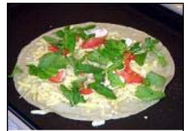
ソバガレットと寒天料理

旅の思い出として、日々、楽しく脳トレを！そして、また自然とのふれあいにお出かけください。