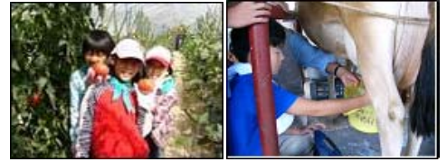
ハケ岳中央農業実践大学校

原村は、全国でも有数の天体観測スポット。小さな星々の輝きは、まるで宝石のようです。