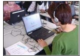
脳トレテスト1回目

蓼科湖畔散策：レジャー、芸術、歴史、自然と様々なふれあいができます。買物も楽しめます。