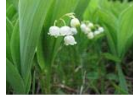
入笠湿原と スズラン