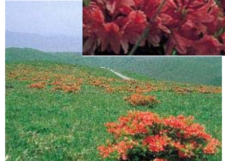
霧ヶ峰高原 レンゲツツジ