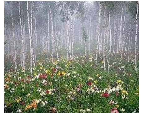
富士見高原 ゆりの里