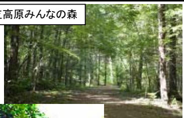
信州大芝高原みんなの森

上の段の町並み、足湯、代官屋敷、関所跡等、散策を楽しめるよう、早めのチェックインをお勧めします。