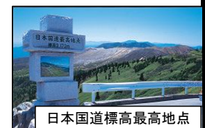
日本国道標高最高地点