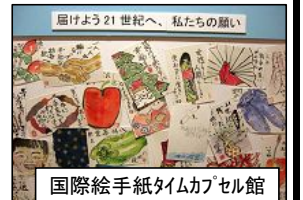
国際絵手紙タイムカプセル館