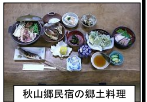
秋山郷民宿の郷土料理