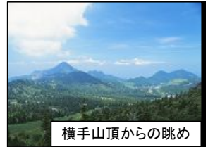
横手山頂からの眺め

蒸気の温泉や緑黄色の温泉など山のいで湯を楽しみながら、美しい紅葉をご堪能ください。