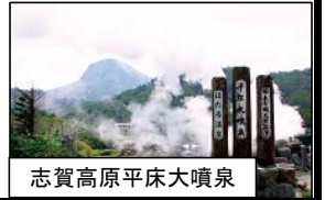
志賀高原平床大噴泉