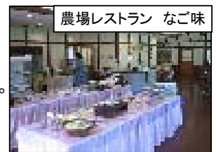
農場レストラン なご味