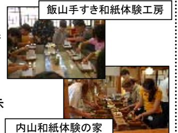
飯山手すき和紙体験工房

内山和紙の紙すきを体験できます。また館内には和紙によるクラフトなどの作品が展示されています。翌日の絵手紙作成のため、オリジナルのハガキを作成してみましょう!!