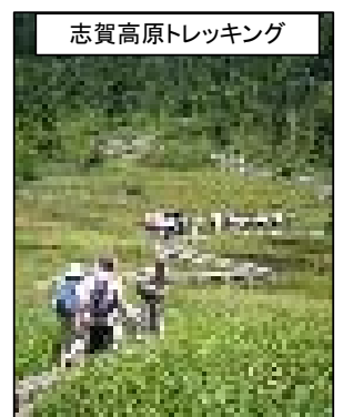
志賀高原トレッキング