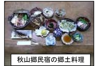
秋山郷民宿の郷土料理