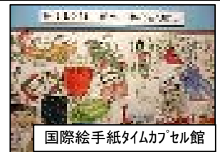
国際絵手紙タイムカプセル館

志賀高原石の湯倉沢川は、日本一標高の高いゲンジボタルの生息地があり、あなたを幻想的な風景にいざないます。（7月中旬～）