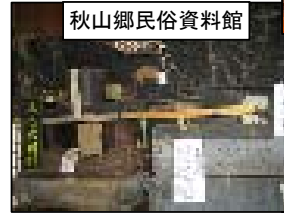
秋山郷民俗資料館