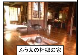
ふう太の杜郷の家