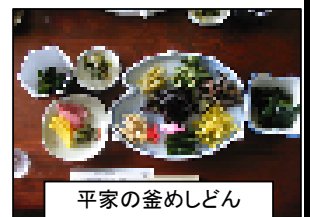
平家の釜めしどん