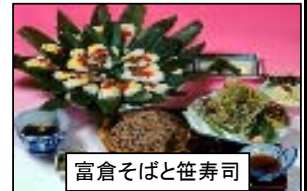
富倉そばと笹寿司