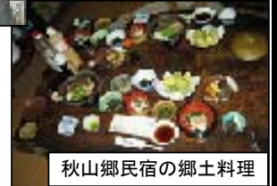
秋山郷民宿の郷土料理