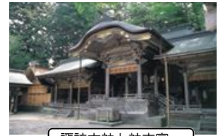
諏訪大社上社本宮