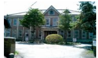
旧山一林組製糸事務所