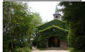
礫山美術館(安曇野市)