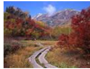
栂池自然園(小谷村)