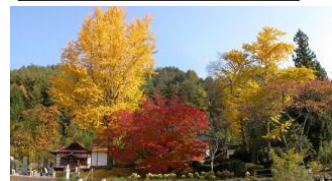
長福寺の紅葉(池田町)