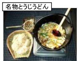
名物とうじうどん