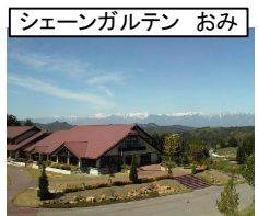
シェンガルテン おみ