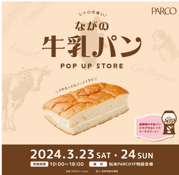
▲松本パルコイベント告知バナー