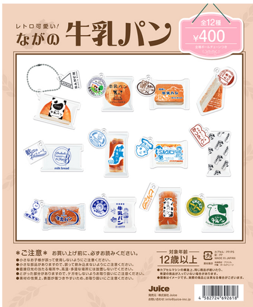
▲カプセルトイ販促台紙イメージ

「地域がさらに元気になる仕組みを考えよう！」を合言葉に、地域の魅力をカプセルトイとして商品化し、地域振興と地域への還元を目的とした企画として、当機構とカプセルトイ発売元（株）Juiceが企画チームを立ち上げ、長野県のご当地パンとして人気の『牛乳パン』をモチーフにしたカプセルトイの販売を計画。販売場所は、同じく地域を盛り上げたいと考える松本パルコを設置1号店（その他の販売場所は長野県内の観光地・商業施設など順次展開予定）とし、牛乳パンの販売を含む発売記念イベントを実施する。